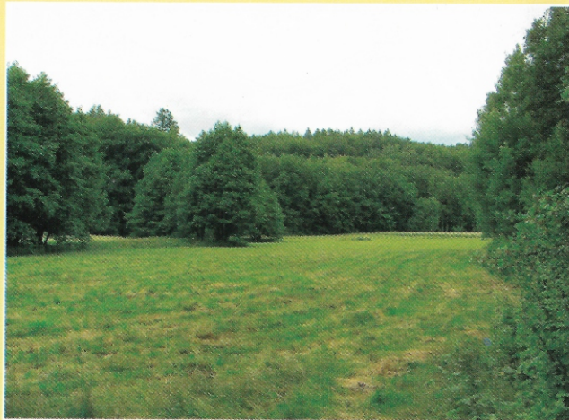
Końskie Łąki latem [TG]

- Pomniki przyrody – na trasie szlaku znajdziemy ich cztery. Są to: