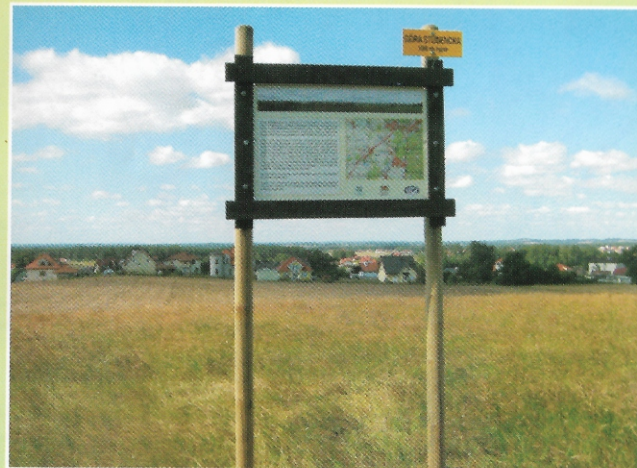
Tablica krajoznawcza na Górze Studenckiej [JE]

- Pozostałości pierwotnej trasy linii kolejowej Kokoszki – Gdynia. W 1921 roku wybudowano tę linię kolejową, by powstająca Gdynia mogła uzyskać połączenie z siecią kolejową Pomorza. W 1933 roku podczas budowy magistrali węglowej odcinek ten skorygowano do dzisiejszego, łagodniejszego przebiegu. Szlak w pewnych partiach biegnie torowiskiem tej pierwotnej linii (m. in. przy Źródle Marii).