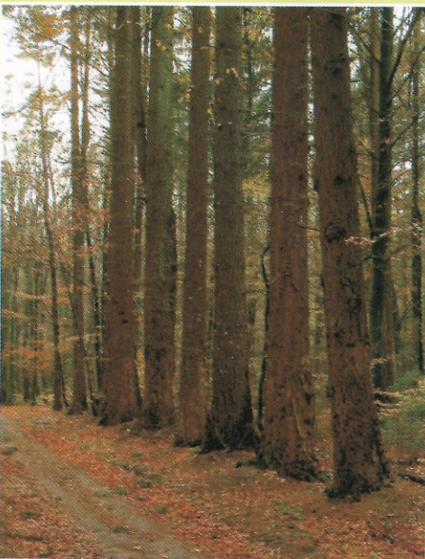
Szpała pomnikowych daglezji [AP]

- Jezioro Wysockie – malownicze jezioro rynnowe o powierzchni 34,7 ha chętnie odwiedzane przez wędkarzy;