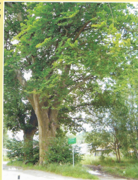
Pomnik Przyrody buk pospolity w Wielkim Kacku [ZŁ]

- Jezioro Osowskie - o powierzchni 37,4 ha, również o charakterze rynnowym.